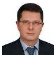
Сергей Жигарев, Председатель Комитета Госдумы по экономической политике и промышленности