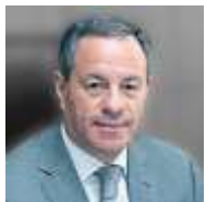
Александр Браверман, Генеральный директор Федеральной корпорации МСП