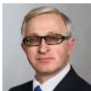
Александр ШОХИН, президент Российского союза промышленников и предпринимателей

Появление в России столь статусной выставки-форума по текстильной и легкой промышленности свидетельствует о том, что отечественный и иностранный бизнес, институты развития предпринимательства и власти спустя долгие годы «недомолвок» наконец-то смогли прийти к общему знаменателю. И действительно, по существу, объединились четыре ведущих текстильных выставки страны – это, без преувеличения, мечта многих лет. Все стороны этого торгово-экономического процесса активно участвуют в возрождения текстильной отрасли России и данная тенденция к объединению усилий сохранится