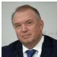
Сергей КАТЫРИН, президент ТПП РФ, председатель Оргкомитета Недели легпрома

Появление в России столь статусной выставки-форума по текстильной и легкой промышленности свидетельствует о том, что отечественный и иностранный бизнес, институты развития предпринимательства и власти спустя долгие годы «недомолвок» наконец-то смогли прийти к общему знаменателю. И действительно, по существу, объединились четыре ведущих текстильных выставки страны – это, без преувеличения, мечта многих лет. Все стороны этого торгово-экономического процесса активно участвуют в возрождения текстильной отрасли России и данная тенденция к объединению усилий сохранится