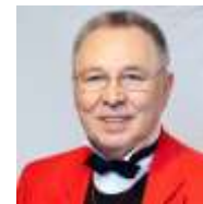
Вячеслав Зайцев, Почетный президент Союзлегпрома, художник- модельер