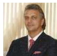
Андрей Разбродин, Президент Союзлегпрома, член Общественной палаты РФ