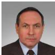
Вячеслав Никонов, Председатель Комитета Госдумы по образованию и науке