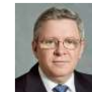
Александр Торшин, Заместитель председателя Центробанка РФ