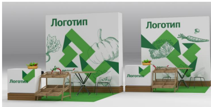
«ОвощКульт»-2016. Пример фирменного стиля