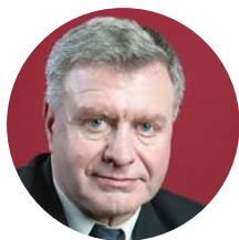
Петр Шелищ Председатель Союза потребителей России

«Сегодня налоги – это главная препона, мешающая раздаче продуктов: их дешевле утилизировать, чем передать на использование бесплатно. Я не думаю, что компании будут злоупотреблять безналоговым режимом.»