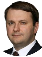
Максим Орешкин Министр экономического развития РФ

«Будем рассматривать вопросы снижения этого порога (беспошлинного импорта), чтобы выравнять конкуренцию как обычной торговли, так и Интернет-торговли и принимать меры по увеличению прозрачности торговли через интернет.»