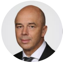
Антон Силуанов Министр финансов РФ

«Будем рассматривать вопросы снижения этого порога (беспошлинного импорта), чтобы выравнять конкуренцию как обычной торговли, так и Интернет-торговли и принимать меры по увеличению прозрачности торговли через интернет.»